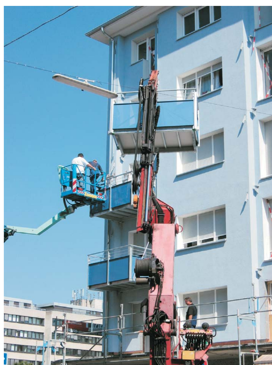
Montage der neuen Stahlbalkone

Aufgrund des schlechten baulichen Zustandes der Balkone wurde die preisgünstigere Variante der Erneuerung der Balkone gewählt. Die alten Betonbalkone wurden abgesägt und durch eine abgehängte Stahlkonstruktion ersetzt.