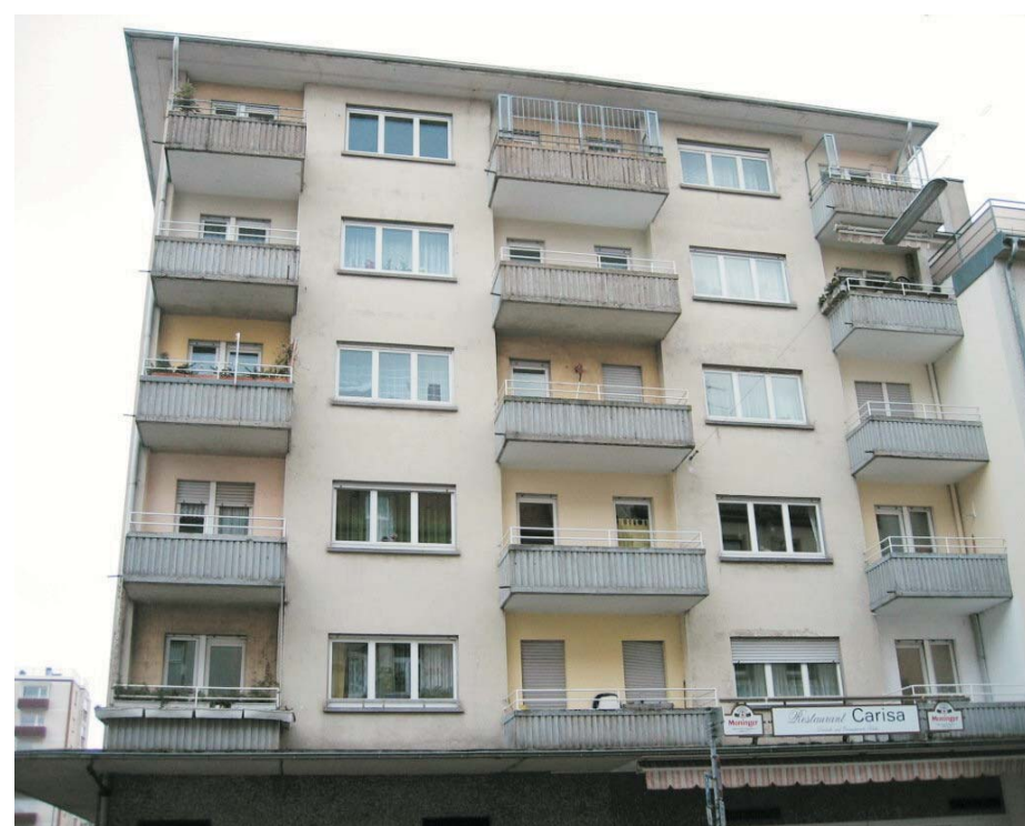
Zustand vor der Sanierung