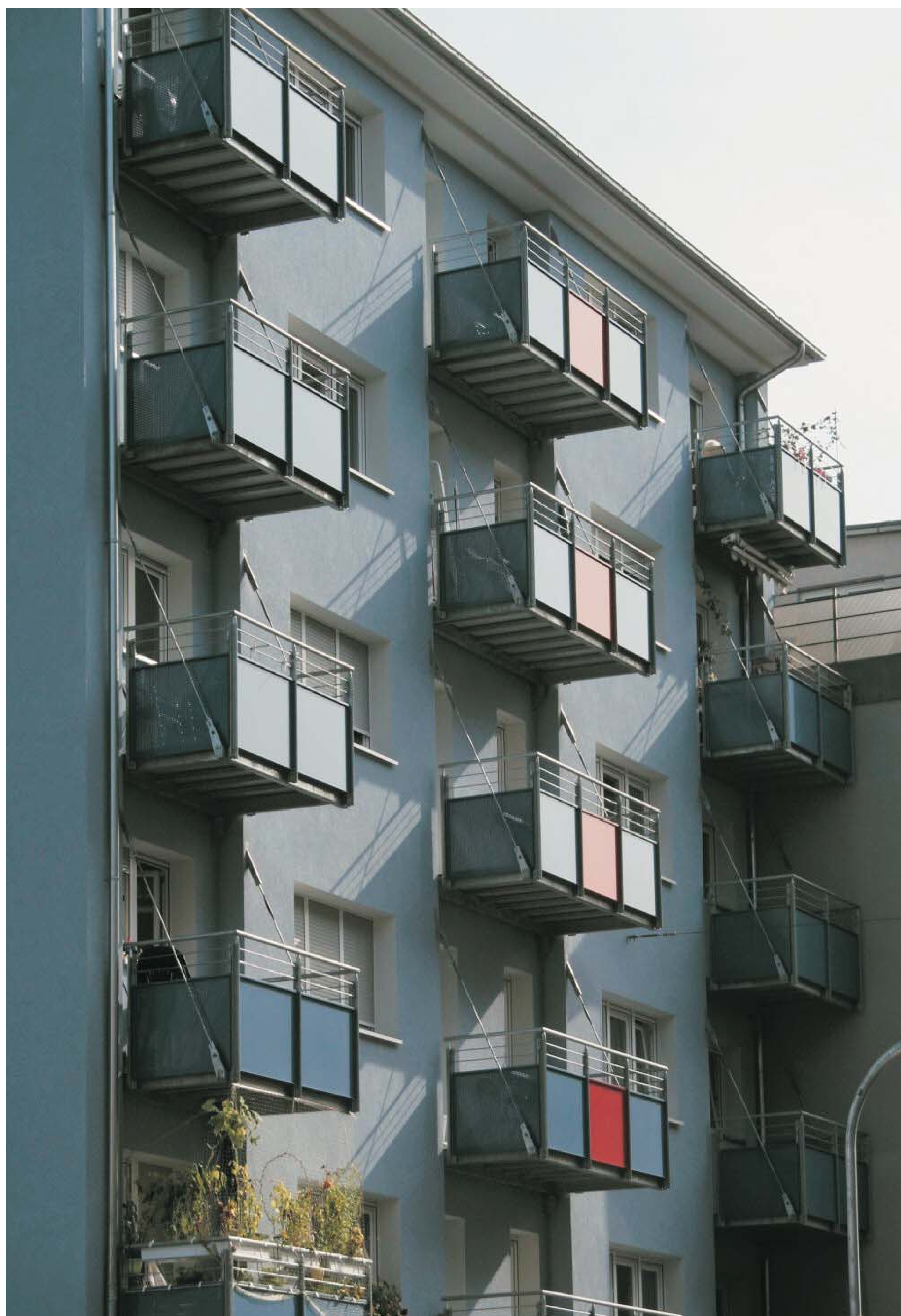
Fassade mit neuen abgehängten Stahlbalkonen nach der Sanierung 2005