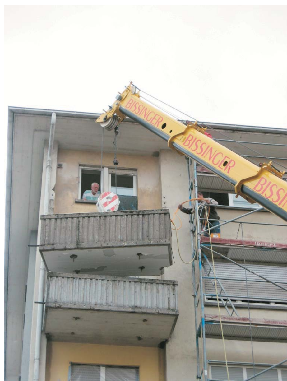
Die schadhafte Balkone werden abgesägt

Die bestehenden Mängel an der Fassade des Mietobjektes und an den Balkonen sollten möglichst kostengünstig behoben werden. Im Zuge der Sanierung wollte die Bauherrschaft die Gelegenheit nutzen und den Energieverbrauch erheblich reduzieren. Auf die Beseitigung der Wärmebrücken wurde besonderer Wert gelegt.